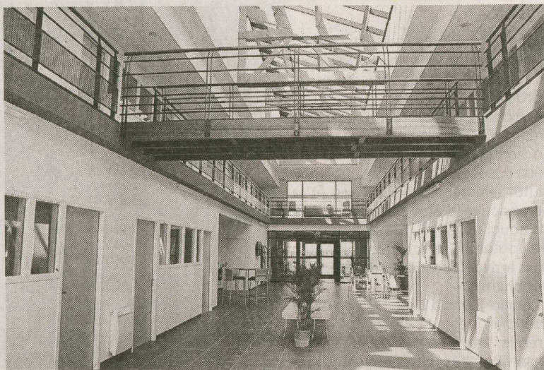
Les locaux sont disposés de part et d'autre d'un grand hall très lumineux.

Quatre mois après son inauguration, l'hôtel d'entreprises de l'Ecoparc de La Gravelle a franchi une nouvelle étape en accueillant deux nouvelles entreprises ravies de leur implantation au sein de cette structure d'hébergement Haute qualité environnementale.